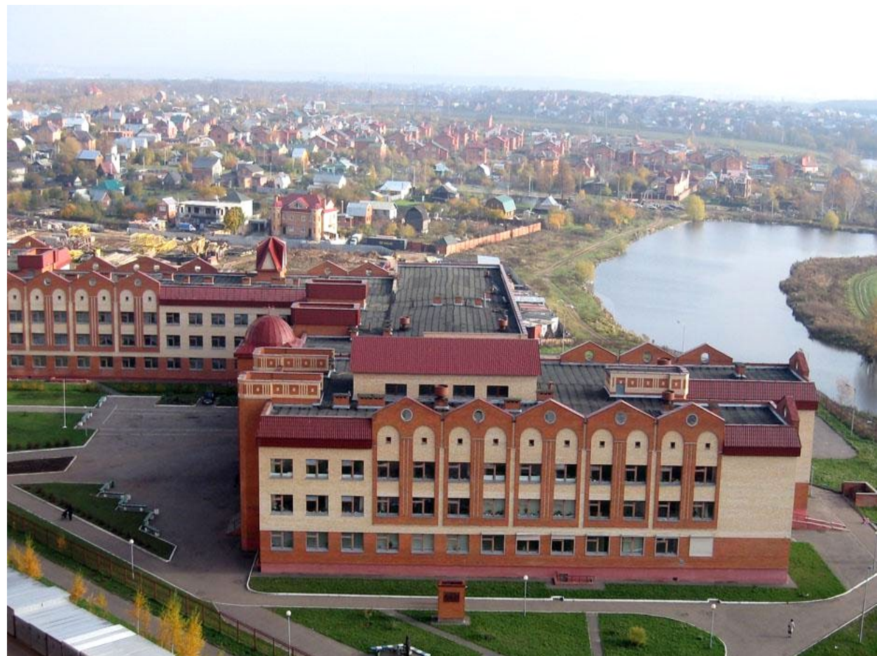
Ленинский г.о., Развилковская школа