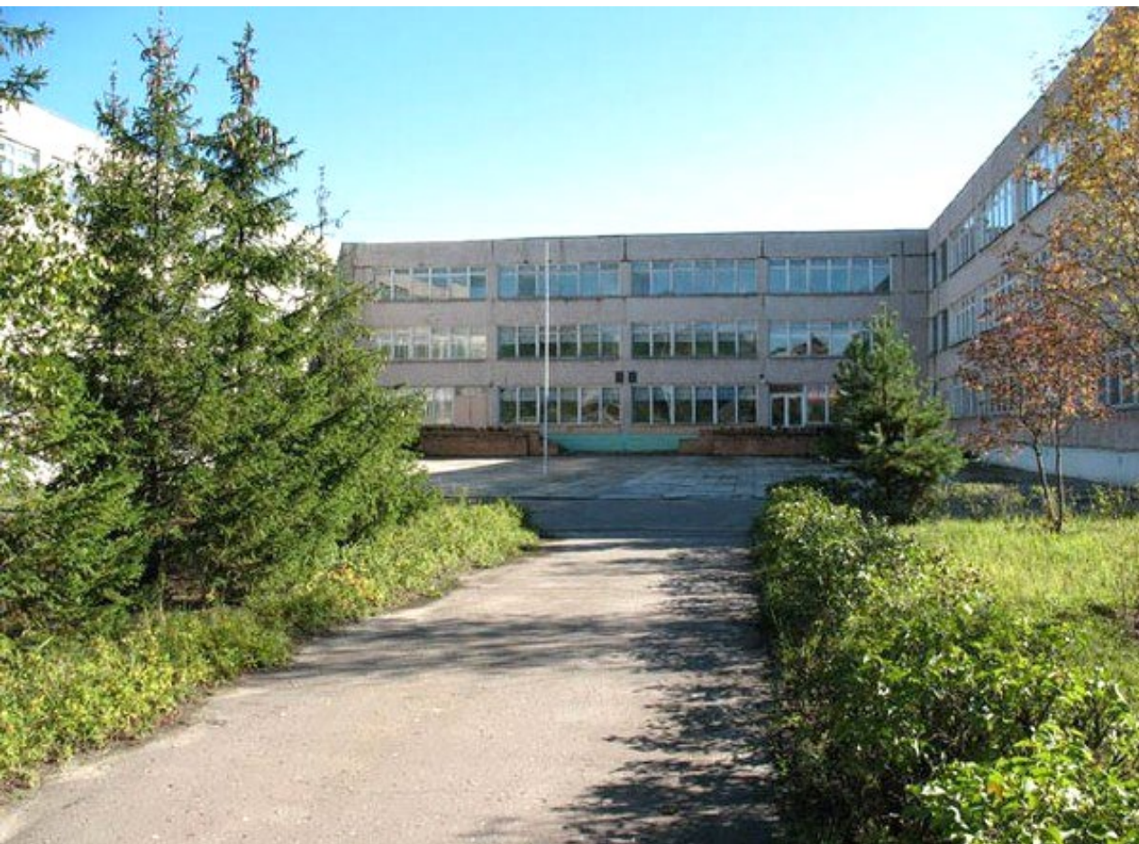
г.о. Воскресенск, школа №14