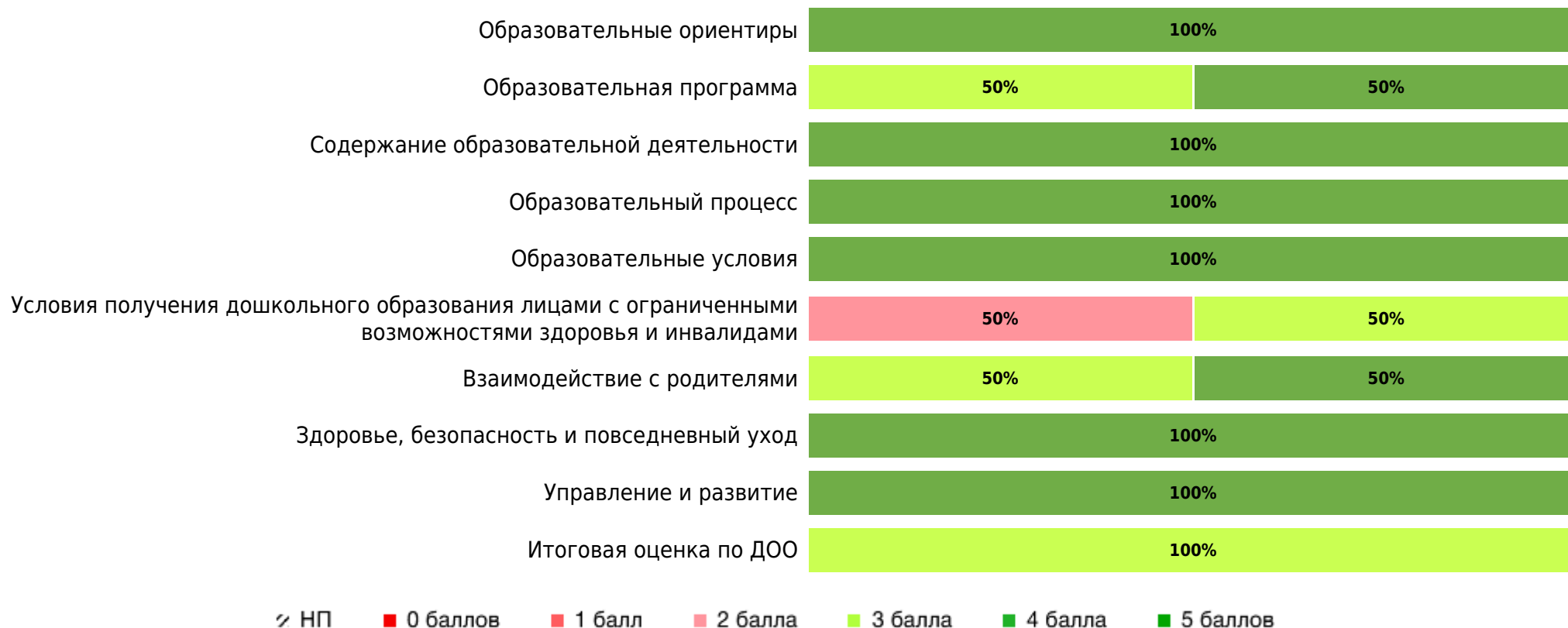
Доли ДОО с разными баллами у педагогов